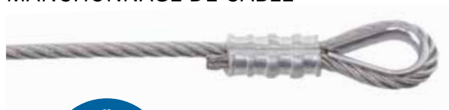
Câble 7 x 19, incl. manchon, cosse non comprise