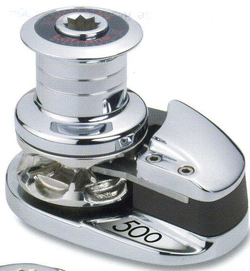
Project X1 - Project 500