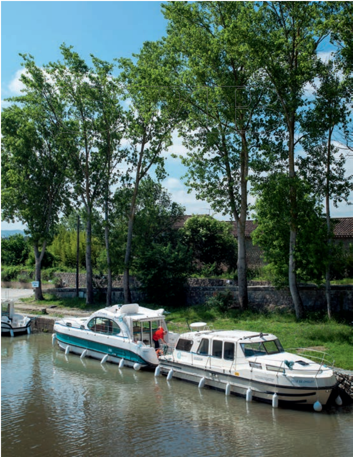
Der Canal du Midi – Magnet für Wasserreisende.

Flüsse und Kanäle wurden in Frankreich schon im Mittelalter zu wirtschaftlichen und militärischen Zwecken ausgebaut, angelegt und miteinander verbunden. Im 19. Jahrhundert hatten die Binnenwasserstraßen eine Gesamtlänge von 11 000 Kilometern. Doch durch den Bau der Eisenbahn und später den Straßenbau verloren die Wasserwege an Bedeutung. Erst mit dem aufstrebenden Wassertourismus erlebten sie seit den 1960er-Jahren einen neuen Aufschwung. Heute gibt es noch rund 8500 Kilometer Wasserstraßen, die fast ausschließlich der staatlichen »Voies navigables de France« (VNF), der Wasserstraßenverwaltung, unterstehen.