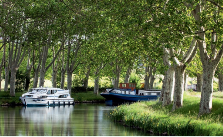
Wie eine lange baumbestandene Allee wirkt der Canal du Midi auf weiten Abschnitten.

wurden später durch Maulbeerbäume ersetzt, die man für die Seidenproduktion benötigte; ihnen folgten italienische Pappeln und schließlich Obstbäume. Für den Nachschub sorgten Baumschulen, die in der Nähe des Kanals angelegt worden waren. Anfang des 19. Jahrhunderts entschied man sich dann für die Aufforstung mit Platanen, da deren Wurzeln eine wirkungsvolle Befestigung der Ufer gewährleisteten. Darüber hinaus vermindert ihr Blätterdach die Verdunstung des Kanalwassers und spendete auf den Treidelpfaden Schatten für Menschen und Zugpferde.