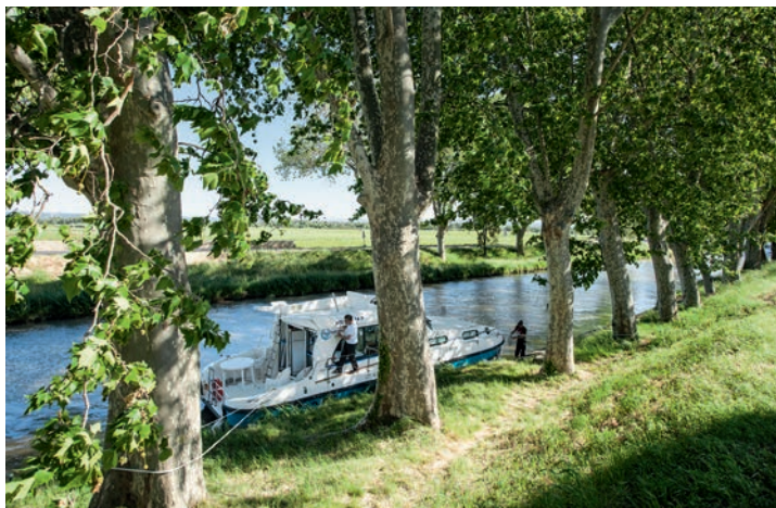
Es gibt genug Häfen, aber es darf auch einfach am Ufer festgemacht werden.

Am Canal du Midi gibt es zahlreiche Häfen und Versorgungsstationen, Tankstellen und Frischwasser, aber auch Fahrrad- und Mopedverleihe sowie gute Bus- und Bahnverbindungen. Vier Naturparks, Freizeit- und Wasserparks, Golfplätze, Surf- und Kiteschulen und der 200 Kilometer lange Sandstrand erfüllen sämtliche Urlaubs- und Erholungswünsche.