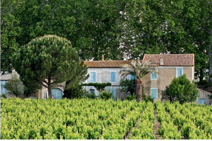
Weingärten um Lézignan-Corbières.