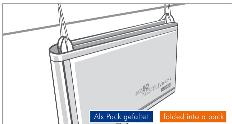
Als Pack gefaltet / folded into a pack

Als Pack gefaltet kann der seaEQ »LF« auch als dicker Flachfender eingesetzt werden. Hier schützt er ihr Boot ideal in der Box, oder wenn Sie im Päckchen liegen.