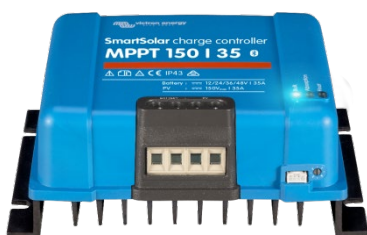
Regolatori di carica SmartSolar MPPT 150/35