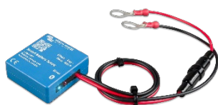
Rilevamento Bluetooth Rilevatore Smart Battery