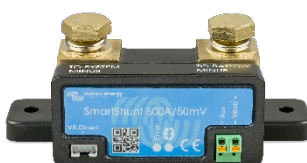
Détection Bluetooth : SmartShunt