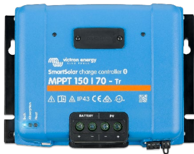
Contrôleur de charge SmartSolar MPPT 150/70-Tr sans option d'écran