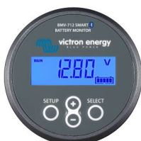
Détection Bluetooth : BMV-712 Smart Battery Monitor