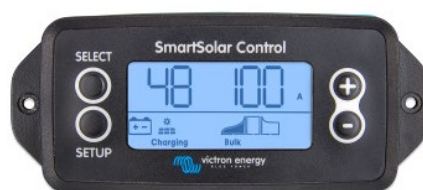
Écran enfichable SmartSolar